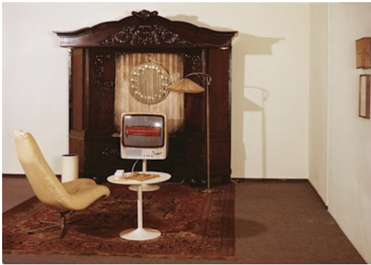
05 Edward Kienholz & Nancy Reddin Kienholz, The Commercial # 2 , 1971-73 Private collection © Kienholz