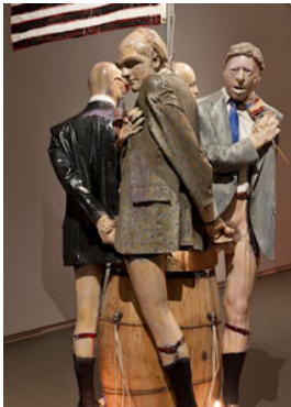
17 Edward Kienholz & Nancy Reddin Kienholz, My Country 'Tis of Thee (Detail), 1991 Collection of the artist, Courtesy of L.A. Louver, Venice, CA © Kienholz; Photo: Schirn Kunsthalle Frankfurt; Foto: Norbert Miguletz