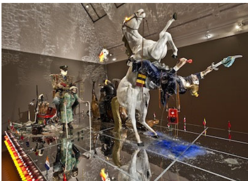
09 Edward Kienholz & Nancy Reddin Kienholz, The Ozymandias Parade (Detail), 1985 Collection of the artist. Courtesy of L.A. Louver, Venice, CA © Kienholz; Photo: Schirn Kunsthalle Frankfurt; Norbert Miguletz