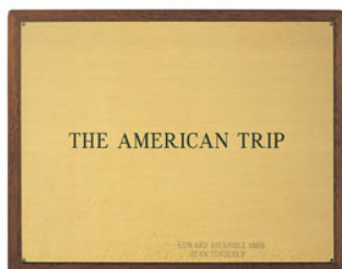
03 Edward Kienholz & Jean Tinguely, The American Trip , Concept Tableau, 1966 Plakette / Plaque Collection of the artist. Courtesy of L.A. Louver, Venice, CA © Kienholz; Photo: Courtesy of L.A. Louver, Venice, CA