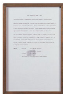
02 Edward Kienholz & Jean Tinguely, The American Trip , Concept Tableau, 1966 Zertifikat / Certificate Collection of the artist. Courtesy of L.A. Louver, Venice, CA © Kienholz; Photo: Courtesy of L.A. Louver, Venice, CA