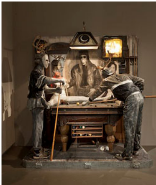
19 Edward Kienholz & Nancy Reddin Kienholz, The Pool Hall , 1993 Collection of the artist, Courtesy of L.A. Louver, Venice, CA © Kienholz; Photo: Schirn Kunsthalle Frankfurt; Norbert Miguletz