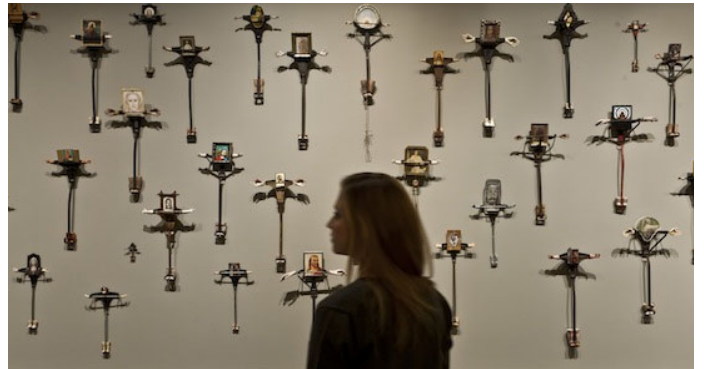
20 Edward Kienholz & Nancy Reddin Kienholz, 76 J.C.s Led the Big Charade , 1993/94 Collection of the artist, Courtesy of L.A. Louver, Venice, CA © Kienholz; Photo: Schirn Kunsthalle Frankfurt; Norbert Miguletz