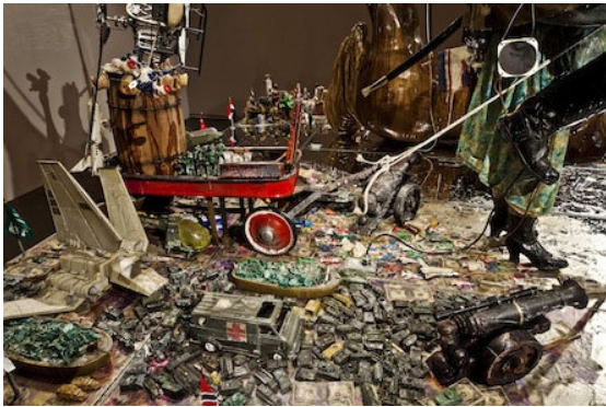
11 Edward Kienholz & Nancy Reddin Kienholz, The Ozymandias Parade (Detail), 1985 Collection of the artist.