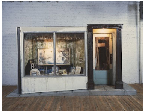
08 Edward Kienholz & Nancy Reddin Kienholz, The Jesus Corner , 1982/83 Northwest Museum of Arts and Culture / Eastern Washington State Historical Society, Spokane, WA, museum purchase and gift of the artists © Kienholz