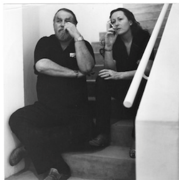
21 Edward Kienholz & Nancy Reddin Kienholz Portrait der Künstler, 1981