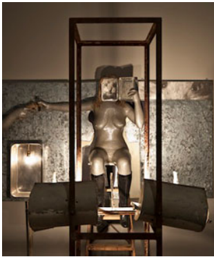
07 Edward Kienholz & Nancy Reddin Kienholz, The Rhinestone Beaver Peep Show Triptych , 1980 Collection of the artist. Courtesy of L.A. Louver, Venice, CA © Kienholz; Photo: Schirn Kunsthalle Frankfurt; Norbert Miguletz