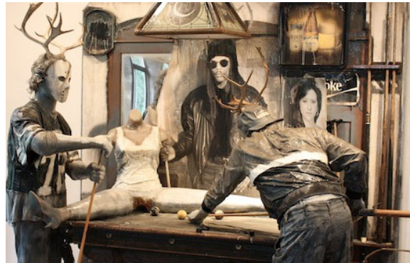
18 Edward Kienholz & Nancy Reddin Kienholz, The Pool Hall (Detail), 1993 Collection of the artist, Courtesy of L.A. Louver, Venice, CA © Kienholz; Photo: Schirn Kunsthalle Frankfurt