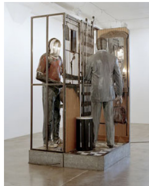
14 Edward Kienholz & Nancy Reddin Kienholz, Claude Nigger Claude , 1988 Collection Magasin 3 Stockholm Konsthall © Kienholz