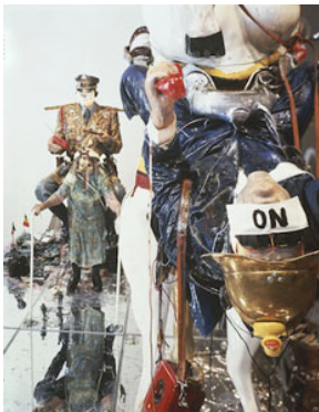
13 Edward Kienholz & Nancy Reddin Kienholz, The Ozymandias Parade , 1985 Collection of the artist. Courtesy of L.A. Louver, Venice, CA © Kienholz; Photo: Kienholz, Courtesy of L.A. Louver, Venice, CA