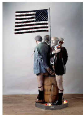
16 Edward Kienholz & Nancy Reddin Kienholz, My Country 'Tis of Thee , 1991 Collection of the artist, Courtesy of L.A. Louver, Venice, CA © Kienholz