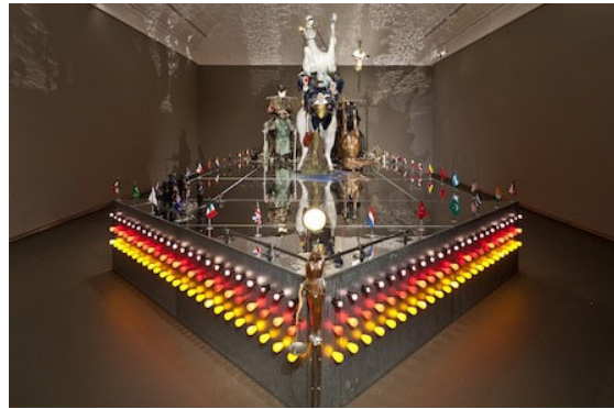
12 Edward Kienholz & Nancy Reddin Kienholz, The Ozymandias Parade , 1985 Collection of the artist. Courtesy of L.A. Louver, Venice, CA © Kienholz; Photo: Schirn Kunsthalle Frankfurt; Norbert Miguletz