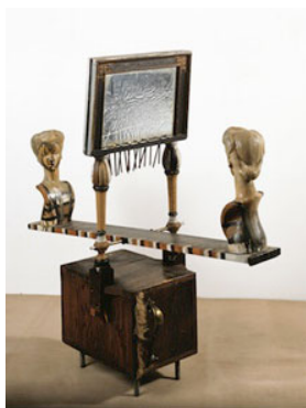
01 Edward Kienholz, The Widow , 1962 Private collection © Kienholz

Die Verwendung von Pressebildern ist ausschliesslich zur Medienberichterstattung erlaubt. Die Erwähnung der Copyrights ist obligatorisch. Publication of press images is reserved exclusively for members of the media. Mention of copyrights and photographic credits is compulsory. La publication des images de presse est réservée aux membres des médias. La mention des ayants-droit et des crédits photographiques est obligatoire.