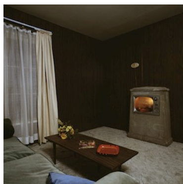
04 Edward Kienholz, The Eleventh Hour Final , 1968 Private collection © Kienholz