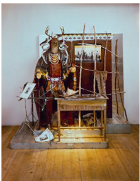
15 Edward Kienholz & Nancy Reddin Kienholz, The Potlatch , 1988 Collection of the artist, Courtesy of L.A. Louver, Venice, CA © Kienholz; Photo: Courtesy of L.A. Louver, Venice, CA