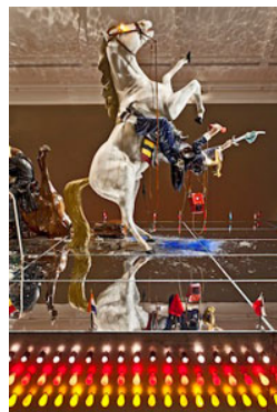
10 Edward Kienholz & Nancy Reddin Kienholz, The Ozymandias Parade (Detail), 1985 Collection of the artist. Courtesy of L.A. Louver, Venice, CA © Kienholz; Photo: Schirn Kunsthalle Frankfurt; Norbert Miguletz