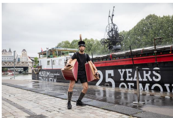
Nevin Aladağ, Body Instruments , 2021, Paris

Un.e performeur.se porte des instruments de musique sur son corps et se déplace ainsi dans l'espace urbain. Les instruments, deux accordéons, des cloches et des tambours portés sur la tête, sont joués par les mouvements du corps. Il en résulte un morceau de musique expérimentale qui oscille entre les sons absolument nécessaires, comme ceux produits par la marche ou les mouvements volontaire, et des sons plus poétiques.