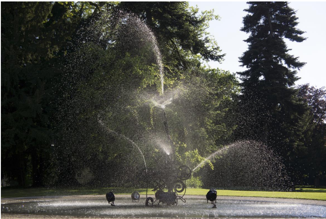
Jean Tinguely, Schwimmwasserplastik (1980) 407 x 214 x 184 cm, ferraille, tuyaux d'arrosage, embouts, moteurs électriques Musée Tinguely, Bâle, donation Paul Sacher

Le point fort du projet Museum Tinguely AHOY! est la Schwimmwasserplastik (1980) de Jean Tinguely, qui se trouve normalement devant le Musée Tinguely, dans le parc Solitude environnant. Elle sera installée pour l'occasion sur le pont de la péniche. Actionnée par des roues peintes en noir, la sculpture-fontaine projette de l'eau dans toutes les directions à partir de cinq buses différentes ; en fonction du vent, ce spectacle de pulvérisation mécanique peut éclabousser le spectateur. Tinguely voulait que la fontaine déverse de l'eau à profusion et dans toutes les directions, comme un feu d'artifice. L'artiste aimait d'ailleurs particulièrement le caractère ludique de l'eau et a créé ainsi des formes éphémères qui en prolongent le jaillissement. De la même manière, il a augmenté ses sculptures de mouvements ou de sons pour générer des expériences sensorielles complètes.