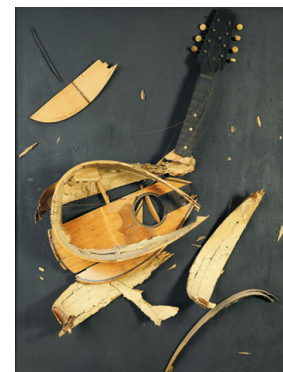
09 Arman, Colère de Mandoline , 1961 zerschlagene Mandoline auf Holzplatte, Sammlung Rira, Köln © 2011 Pro Litteris, Zürich; Foto: Alle Rechte vorbehalten