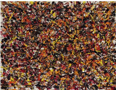
13 Arman, Hello Jackson , 1990 Privatsammlung © 2011 Pro Litteris, Zürich, Foto: François Fernandez