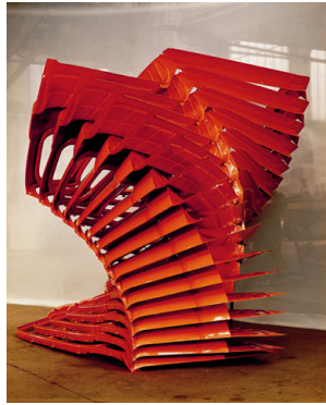
11 Arman, Accumulation Renault No. 101 (La victoire de Saletotrice) , 1967 Karosserieelemente, Privatsammlung Boullion © 2011 Pro Litteris, Zürich