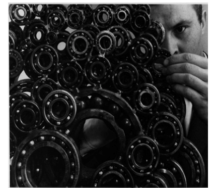
15 Arman bei der Arbeit an Teotihuacan, 1963 © Roy Lichtenstein Foundation Foto: Shunk-Kender