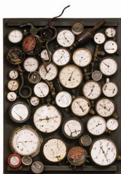
07 Arman, La Colère monte , 1961 Accumulation von Manometern in Kasten aus Holz und Plexiglas Collection Sylvio Perlstein © 2011 Pro Litteris, Zürich