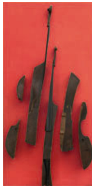
17 Arman, Subida al cielo , 1961 Coupe eines Kontrabass auf Holz montiert Sammlung Stéphanie und Oliver Dacourt, Paris Courtesy cudemo, Monaco, Dauerleihgabe im Mamac, Nizza, © 2011 Pro Litteris, Zürich

Die Verwendung von Pressebildern ist ausschließlich den Medien gestattet. Die Erwähnung der Copyrights ist obligatorisch. Publication of press images is reserved exclusively for members of the media. Mention of copyrights and photographic credits is compulsory. La publication des images de presse est réservée aux membres des médias. La mention des ayants-droit et des crédits photographiques est obligatoire.