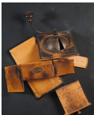
05 Arman, Moulin Cubiste , 1962 Sammlung Rira, Köln © 2011, Pro Litteris, Zürich, Foto: alle Rechte vorbehalten