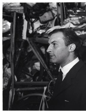
14 Arman am Tag der Eröffnung von «Le Plein» 1960 © Roy Lichtenstein Foundation Foto: Shunk-Kender