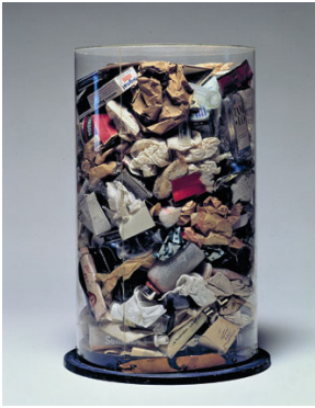
10 Arman, Poubelle de Jim Dine , 1961 Abfall in Plexiglaskasten Sonnabend Collection, on loan to Museo di arte Moderna e Contemporanea di Trento e Rovereto (MART), Italy © 2011 Pro Litteris, Zürich, Foto: Courtesy Sonnabend Collection