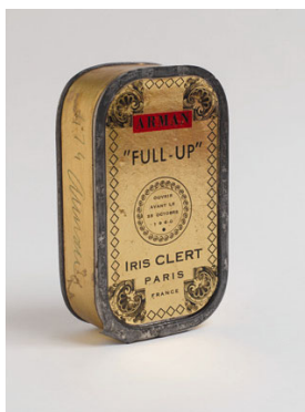
08 Arman, Full-up. Ouvrir avant le 25 octobre, 1960 / Abfall in Sardinenbüchse, diente als Einladung zur Eröffnung von Armans Ausstellung „Le Plein“ in der Galerie Iris Clert, Paris Centre Pompidou, Bibliothèque Kandinsky, Fonds Galerie Iris Clert, Paris