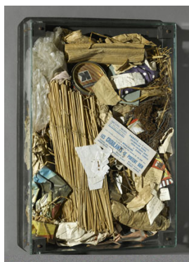
04 Arman, Poubelle des Halles , 1961 Centre Pompidou © 2011 Pro Litteris, Zürich