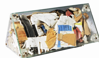
03 Arman, Poubelle (Beaux Arts)/ Poubelle Tinguely , Erste Hälfte 1960er Jahre Musée d'art et d'histoire, Fribourg Donation Niki de Saint Phalle, 2001 © 2011 Pro Litteris, Zürich, Foto: Musée d'art et d'histoire, Fribourg (Primula Bosshard)