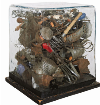
16 Arman, Hello Jackson , 1990 Privatsammlung © 2011 Pro Litteris, Zürich, Foto: Courtesy Galerie Reckermann, Köln