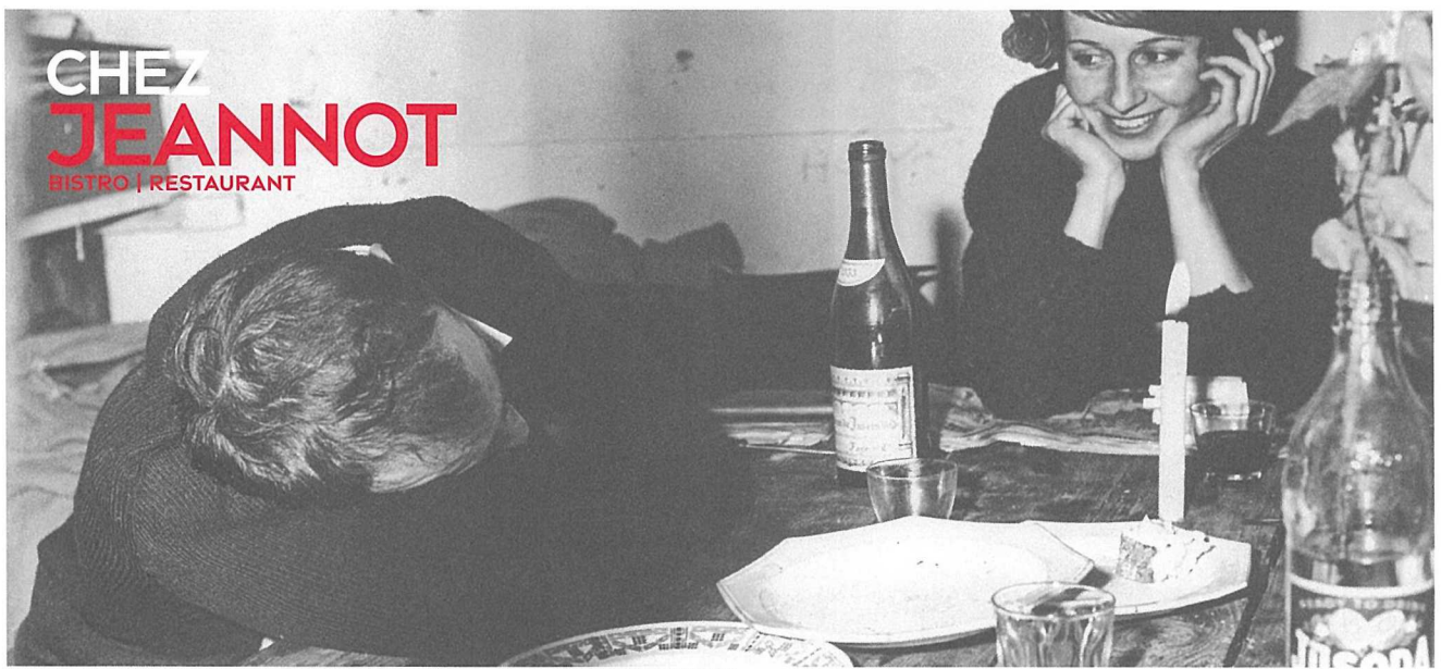
JEAN TINGUELY IM ATELIER IMPASSE RONSIN, PARIS, ENDE 1950ER-JAHRE