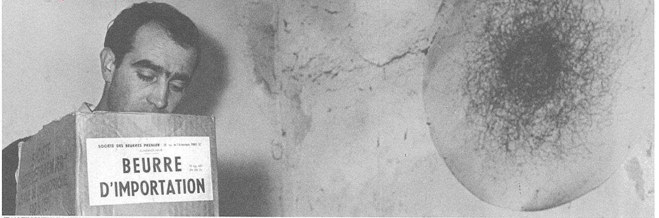
JEAN TINGUELY IM ATELIER IMPASSE RONSIN, PARIS, ENDE 1950ER-JAHRE