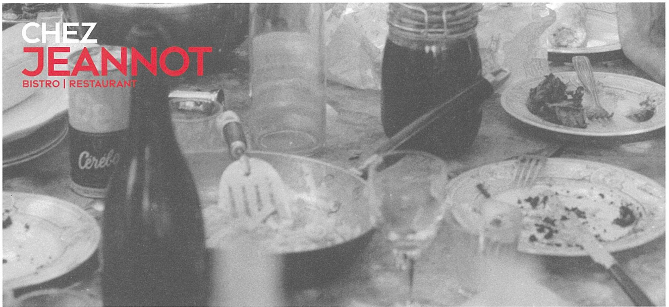
RICO WEBER, JEAN TINGUELY UND NIKI DE SAINT PHALLE BEIM ESSEN IM GARTEN DES ATELIERS IN SOISY-SUR-ECOLE, 1971 (DETAIL)