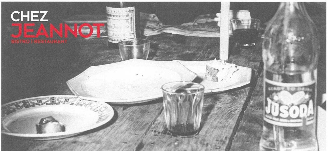
JEAN TINGUELY UND EVA AEPPLI IM ATELIER IMPASSE RONSIN, PARIS, ENDE 1950ER-JAHRE (DETAIL)