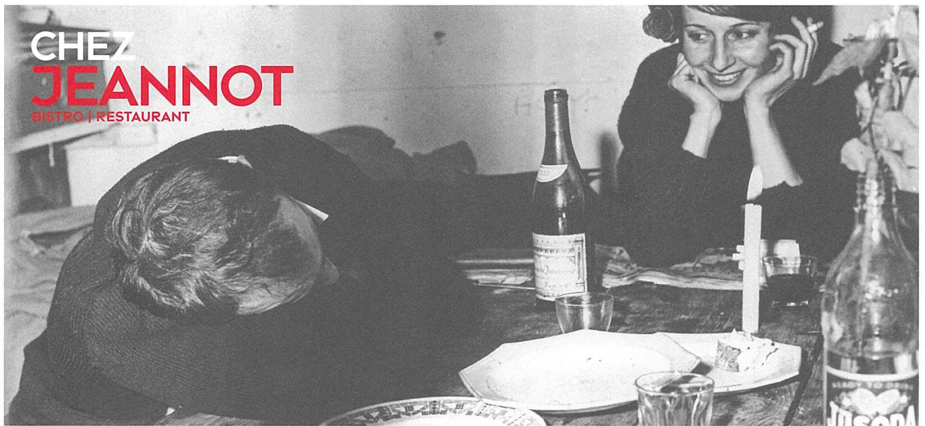
JEAN TINGUELY IM ATELIER IMPASSE RONSIN, PARIS, ENDE 1950ER-JAHRE