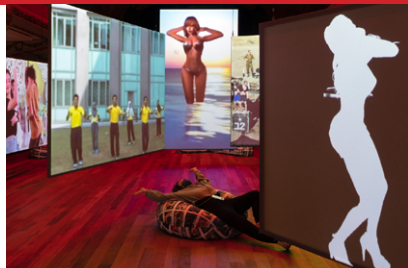
Anouk Kruithof, Universal Tongue , Kunstencentrum Vooruit Ghent, Belgique, 2021

UNIVERSAL TONGUE est née de la fascination d'Anouk Kruithof pour les vidéodanses diffusées en ligne qui incarnent l'expression individuelle, l'identité culturelle, l'autonomisation et la joie. Dans le cadre de travaux de recherche archéo-numériques, l'artiste a collecté 8 800 vidéos à partir desquelles elle a réalisé une installation vidéo de 8 canaux compilant 1 000 styles de danse provenant du monde entier. Le travail artistique de Kruithof se caractérise par une exploration pluridisciplinaire et critique des univers visuels numériques.