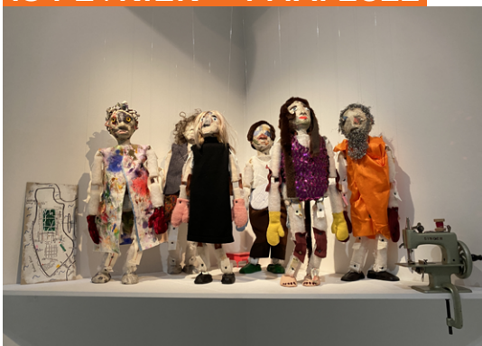
Wiveka Wachtmeister, The Druds , 2020

Grande exposition consacrée à ÖYVIND FAHLSTRÖM (1928–1976), artiste aux multiples talents, et à plus de 80 de ses ami.e.s issus des domaines de la poésie, de l'art, de la musique, de la danse, du théâtre, de la performance et du cinéma. Dédiée autant à des artistes femmes que hommes, parmi lesquels Marisol, Warhol, Kogelnik, Cage, Ringgold, Rauschenberg, Oldenburg, Lebel, Bontecou, Matta, ainsi que Niki & Jean, cette exposition explore la création dans les années 1950–1970 à Rome, Stockholm, Paris et New York.