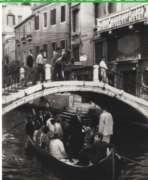
L'enterrement de la «Chose» de Tinguely, happening de Jean-Jacques Label, Venise, 14 juillet 1960

JEAN-JACQUES LABEL , pionnier de l'art-action, fut l'auteur du premier happening en Europe le 14 juillet 1960 : « L'enterrement de la «Chose» de Tinguely ». Sa passion pour Nietzsche et Bakounine – parmi d'autres philosophes – rencontre celle de Tinguely pour Kropotkine et Bergson. Avec sa vidéo-installation déambulatoire Les Avatars de Vénus il traite la question de la mémoire collective des archétypes qui, d'une époque à l'autre, d'une culture à l'autre, surdétermine l'histoire des arts.